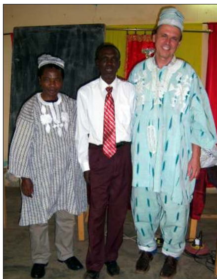
Gastgeschenke - im Burkina Faso Outfit

Auf der nächtlichen Heimkehr, warfen uns eine Gruppe Jugendlicher einen großen Stein in die Windschutzscheibe, um unser Fahrzeug zum Anhalten zu zwingen. Der nigerianische Fahrer raste durch die illegal errichtete Straßensperre. Der Stein schlug erst auf den Holm und rutsche dann auf Augenhöhe des Fahrers über